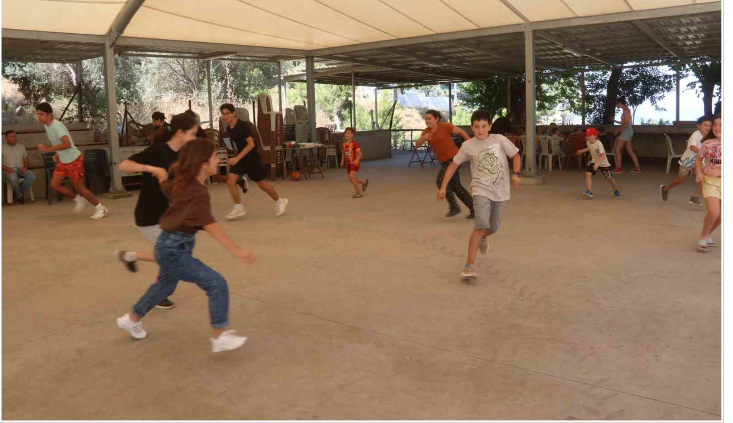
Amerika'dan geldiler, tüm imkanlarını köydeki çocuklar için seferber ettiler

6 | 6 Amerika'dan geldiler, tüm imkanlarını köydeki çocuklar için seferber ettiler