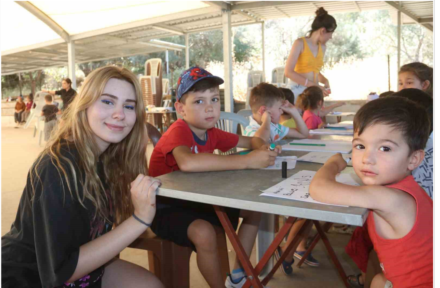
Amerika'dan geldiler, tüm imkanlarını köydeki çocuklar için seferber ettiler