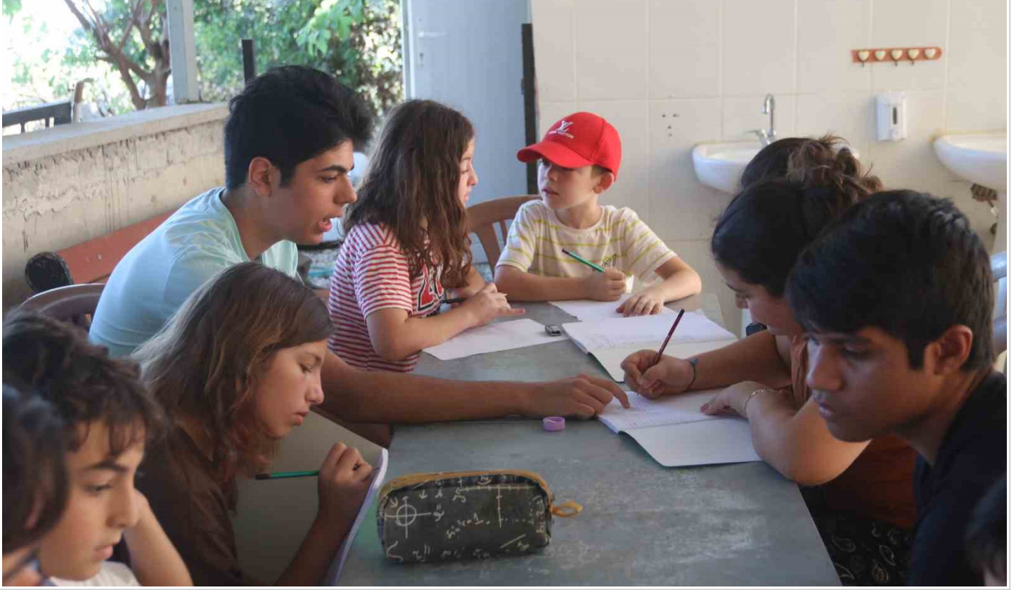
Amerika'dan geldiler, tüm imkanlarını köydeki çocuklar için seferber ettiler