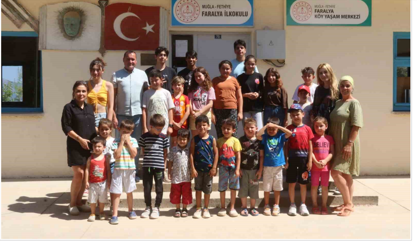
Amerika'dan geldiler, tüm imkanlarını köydeki çocuklar için seferber ettiler

ETİKETLER: Amerika'dan, Çocuklar, ettiler, geldiler, için, imkânlarını, köydeki, seferber, tüm