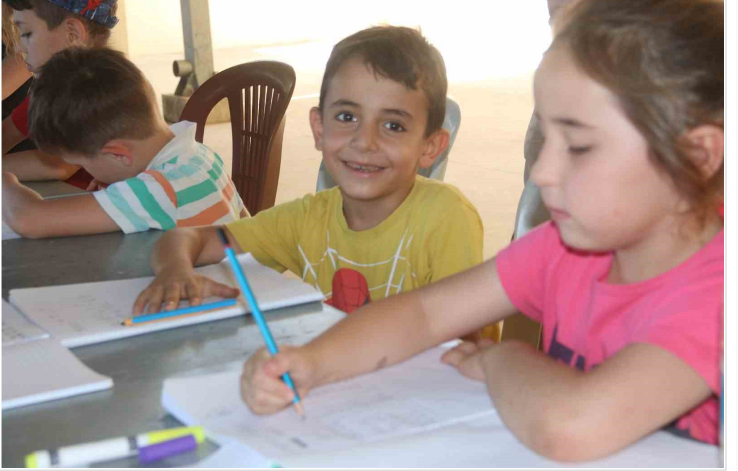
Amerika'dan geldiler, tüm imkanlarını köydeki çocuklar için seferber ettiler

3 | 6 Amerika'dan geldiler, tüm imkanlarını köydeki çocuklar için seferber ettiler