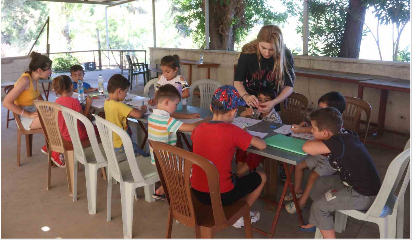
Amerika'dan geldiler, tüm imkanlarını köydeki çocuklar için seferber ettiler